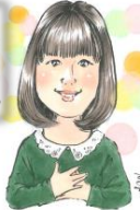
イラスト 河合菜摘